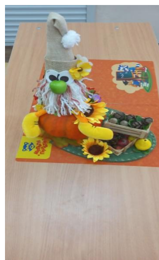
Огородничок с подарками