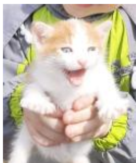
Мурчелло – дачный постоялец