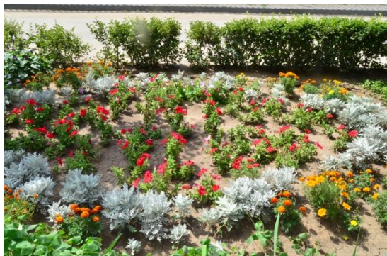
Мой дизайн цветочной клумбы