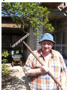
Главный по даче – дедушка