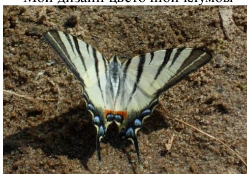
Гостя на дачной пашне