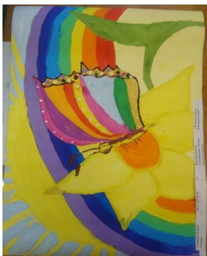
Бабочка на лилии